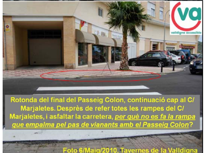
Figura 3: Diferents problemes d'accessibilitat que Vallidigna Accessible ha advertit a l'Ajuntament, i que encara estan pendents de resoldre.

L'Accessibilitat Universal sols serà possible si es compren una idea molt senzilla;