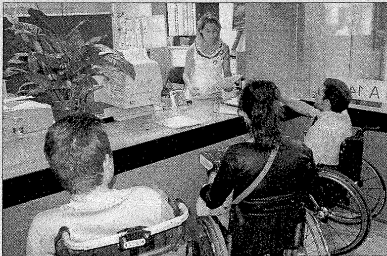
Tres vecinos de Tavernes entregan las firmas en el ayuntamiento.

Desde el 2003 denuncian que la Biblioteca tiene un gran escalón que les impide el acceso. La entra-